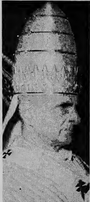
Papa Paulo VI

CIUDAD DEL VATICANO--UPI--Santa Sede a ripiti oposicion di iglesia na control artificial di natalidad y a critica e presidente di Estados Unidos, Lyndon B. Johnson, pa a presenta "problemanan serio di caracter moral", pidiendo e metodonan ey den e zonan sub-alimenta na mundu.